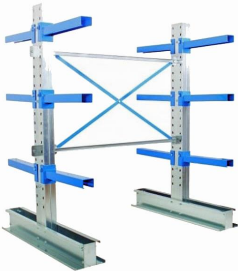
Totaldjup med 600mm armar 1380mm Totaldjup med 1000mm armar 2180mm